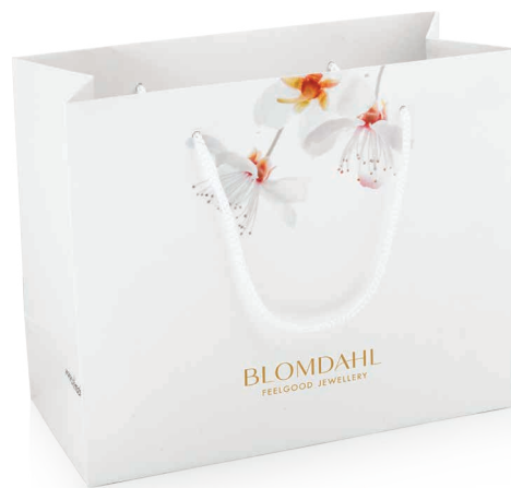
TOREBKA UPOMINKOWA 310-0507