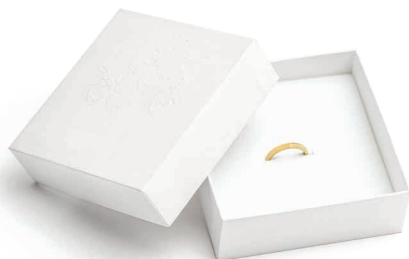
PUDEŁKO UPOMINKOWE na hypoalergiczne bransoletki, naszyjniki, pierścionki i obrączki 310-0207

Pozwól swoim klientom przymierzyć bransoletki, naszyjniki, pierścionki i obrączki